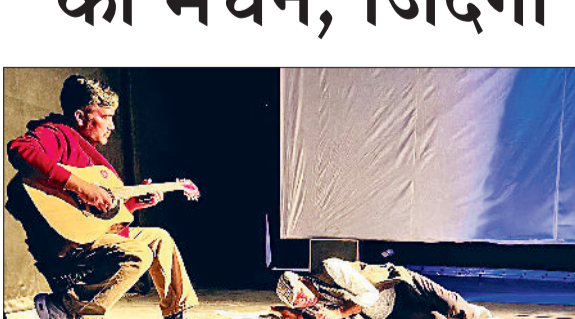
रोहताक। नाटक प्रस्तुत करते कलाकार।