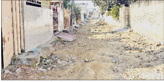
रोहताक। तिलक नगर की टूटी हुई गली का दृश्य।

अक्टूबर में खोदी गई गली, नहीं बनी, लाइन जोड़ने के नाम पर करवाई थी खुदाई, दर्जन से अधिक घरों के सामने गली खोदकर छोड़ी, सैकड़ों राहगीरों को हो रही परेशानी