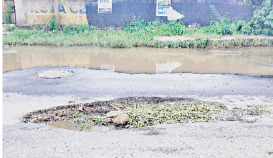
अनार सेक्टर, गली-नोहल्ले, वार्ड व गांव में सनस्यारों से हैं परेशान तो इन नंबर 9253681012 पर करें क्वेट्रप्ल। इन उठाएंगे आपका मुद्दा।

बारिश के मौसम में सड़कों पर पानी भर जाता है और इन गड्ढों में कई कई दिनों तक पानी खड़ा रहता है। इसके कारण स्थानीय लोगों को भारी परेशानियों का सामना करना पड़ता है। शहर के सबसे पॉपुलर इलाक में ऐसे हालात प्रशासन की पोल खोलते नजर आ रहे हैं। लोगों की मांग है कि प्रशासन इस ओर ध्यान दे और सड़कों की मरम्मत कराए, ताकि टूटी सड़कों से लोगों को राहत मिल सके।