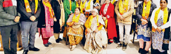
हरिभूमि न्यूज ▶▶रोहताक